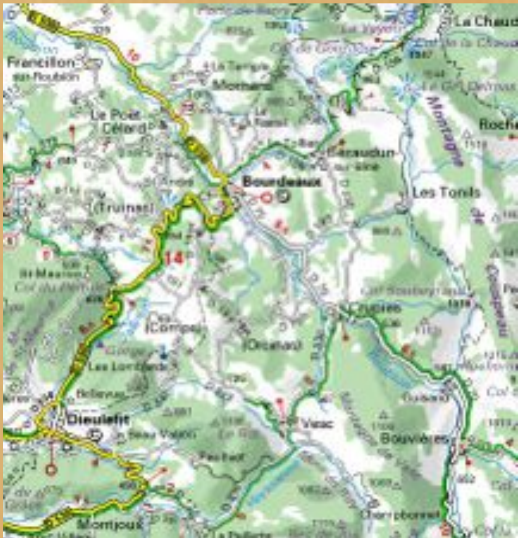
Pays de Bourdeaux, Drôme, Rhône-Alpes